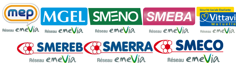
Exemples d'intégration du « Réseau emeVia » aux logos des mutuelles étudiantes de proximité

La création du Réseau emeVia, en écho au nouveau de l'USEM, marque également la volonté des mutuelles de proximité de s'adapter à la plus grande mobilité des étudiants et à des besoins de prévention toujours aussi importants. Le paysage mutualiste comprend 11 mutuelles étudiantes de proximité aux noms différents, noms auxquels s'ajoutait celui de l'USEM. Afin de bénéficier d'une identité commune sur l'ensemble du territoire national, les mutuelles étudiantes de proximité bénéficient désormais de la mention « Réseau emeVia » accolée à leur logo. Gage de qualité, cette reconnaissance apporte aux étudiants en mobilité la certitude de pouvoir bénéficier tout au long de leurs études de l'expertise et de la compétence de mutuelles qui possèdent les mêmes exigences et les mêmes valeurs.